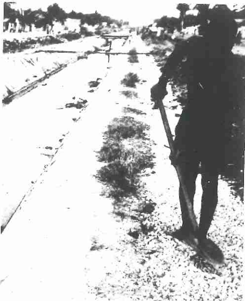
de landbouw in de derde wereld wordt sterk beheerst door de multinationals.

en exporteurs van agrarische producten zijn, zowel in rijke als in arme landen. Van alle sojaexporten van de VS wordt 90% gecontroleerd door vier concerns.