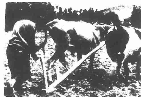
als de toename van de produktie maar terecht komt bij de mensen die het nodig hebben.

Vanwege de economische structuur waarbinnen ze geproduceerd en gedistribueerd worden, betekenen de nieuwe eiwitrijke produkten dus geen bijdrage aan de oplossing van het wereldvoedselprobleem. Datzelfde geldt voor de veel gehoorde kreet dat wij in het westen maar eens minder vlees moeten gaan eten. Het is waar dat bij de omzetting van plantaardige produkten door dieren voor de mens beschikbare energie en verteerbaar eiwit verloren gaat. Dat verlies moet niet overdreven worden. Bij extensief gehouden vleesrunderen en bij melkkoeien gaat het verhaal niet op wegens de vertering van voor de mens niet geschikt ruwvoer. Ook bij varkens en kippen