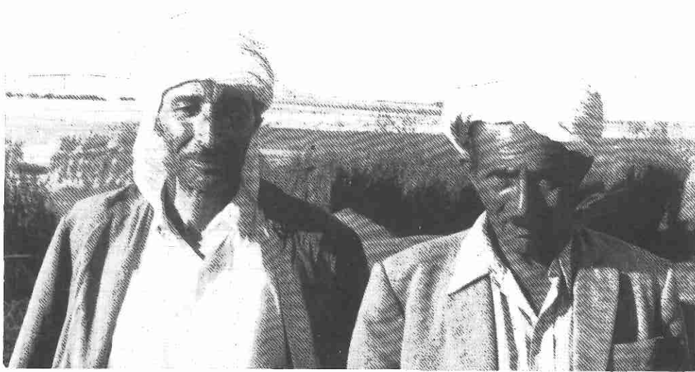
het land voor de mensen die er op werken !

(Development Forum, een uitgave van de Verenigde Naties).